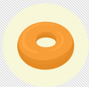
M・Tさん [スリースノー東京]